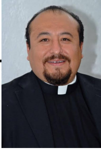
La Voz del Párroco

Boletín Informativo de la Parroquia de La Divina Pastora. año 5 N° 51 - diciembre de 2021