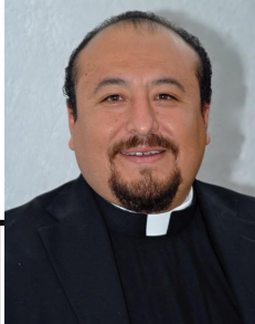
La Voz del Párroco

Boletín Informativo de la Parroquia de La Divina Pastora. Año 5 N° 49 - mayo de 2021